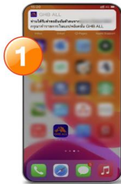
1. หลังจากเปิดบัญชีออนไลน์ผ่านแอปธนาคารอื่นเรียบร้อยแล้วจะได้รับข้อความในแอป GHB ALL แจ้งเตือนการยืนยันตัวตนจากสถาบันการเงินอื่น