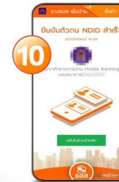
10. ยืนยันตัวตนสำเร็จ