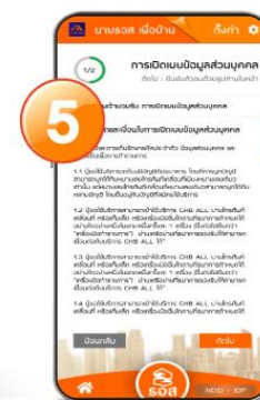
5. อ่านและยอมรับการเปิดเผยข้อมูลส่วนบุคคล กดปุ่ม “ถัดไป”