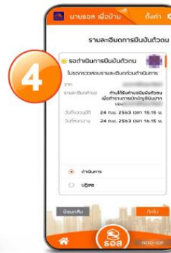
4. ตรวจสอบรายละเอียดการยืนยันตัวตน และกดปุ่ม “ถัดไป”