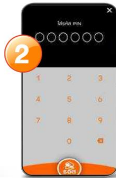
2. “ใส่รหัส PIN 6 หลัก”