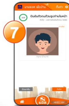
7. ถ่ายภาพใบหน้าตนเอง และทำตามที่แจ้งให้ครบถ้วน กดปุ่ม “ถัดไป”