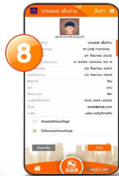
8. ตรวจสอบข้อมูลความถูกต้อง และยินยอมเปิดเผยข้อมูล กดปุ่ม “ถัดไป”