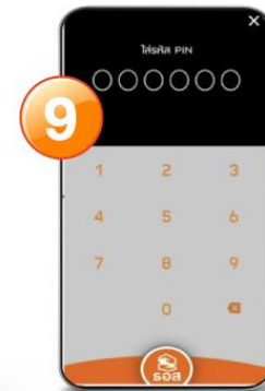
9. ใส่รหัส PIN 6 หลัก